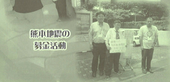
チーム太陽もお手伝い