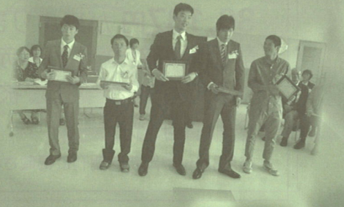
5年表彰の本人さん達