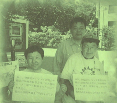
暑い中、駐車禁止の看板を 持ってがんばりました